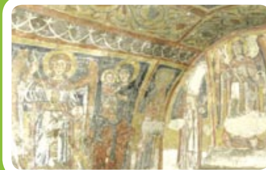
L'INTERNO DELLA CRIPTA DI SANTA MARGHERITA A MELFI

Ma Federico II si occupò di sviluppo agricolo anche attraverso i due centri di Leonessa e Parasacco . Si tratta di due borghi ora appannati dal vicino stabilimento della Fiat , ma che erano abitati e coltivati già al tempo dei Dauini e dei Romani . L'Imperatore svevo le scelse come vere e proprie aziende agricole e zootecniche e le curava personalmente. Posizionate lungo il tratturo regio che univa il Molise alla Puglia e che lambiva questa parte di Lucania , ancora oggi si può notare di entrambi la conformazione tipica delle stazioni di posta.