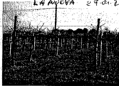
La sede della Cm Collina Matera e un vigneto